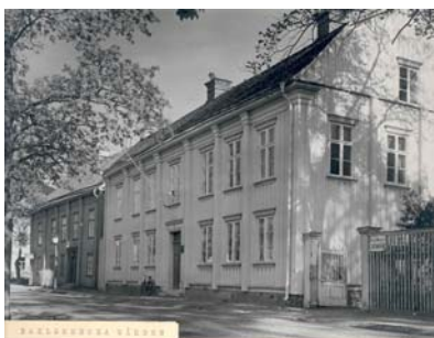
Kvarteret Almen mot Älvgatan

Byggnadsnämnden 1971- och Gatu- och parknämnden 1971-1985 är två områden som har tillgängliggjorts hittills under projektiden. I deras arkiv kan man, till exempel, hitta handlingar rörande stadsmiljön; bilderna här nedanför visar delar av kvarteret Almen, som är hem till både Stadshuset och Kommunarkivet.