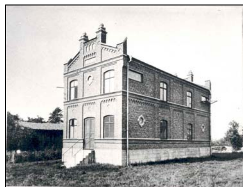
Mottagningsstation för Dejefors kraft i Haga vid Östra station 1905.

1948 började utbyggnaden av fjärrvärme, den första i sitt slag i Sverige. Då hade Karlstads Mekaniska Werkstad bland annat krävt att få sina lokaler